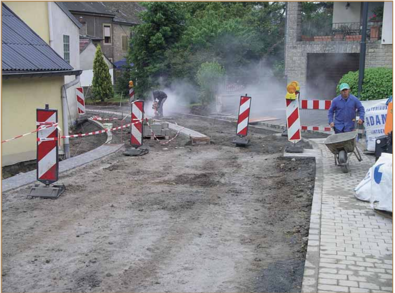
Aarbechten an der „rue Knepel“ zu Lëntgen